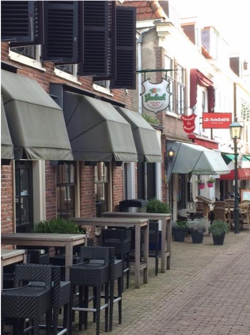
Terrassen in het Huygenskwartier in Oud-Voorburg.

We reflecteren op de bereikte resultaten en effecten in relatie tot de doelstellingen van de pilot en door de deelnemers geformuleerde ambities. Hiermee richten we ons op verankering van de resultaten en geleerde lessen in en buiten de pilotgemeenten, met aanbevelingen voor (lokale) vervolg(keuzes). In deze eindpublicatie adresseren we ook de landelijke aandachtspunten die tijdens de pilot zijn gebleken. We besteden in deze eindpublicatie achtereenvolgens aandacht aan de doelen en aanpak van de pilot (hoofdstuk 2), initiatieven en verlichte regels (hoofdstuk 3), aanbevelingen (hoofdstuk 4) en de ambities (hoofdstuk 5).