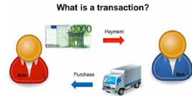
Figuur 1 Voorbeeld van een transactie: twee waardestromen (purchase en payment)

teren, contract maken, bestellen, bevestigen, inplannen, factureren, betalen, evalueren, registreren en administreren. De kern van 'Blockchain Organiseren' is het overdragen van waarden (bijvoorbeeld een vrije palletplaats in een vrachtauto) van aanbieder (bijvoorbeeld een vervoerder) naar vrager (bijvoorbeeld een verlader). De kunst is om dit tegen zo laag mogelijke transactiekosten te doen. In de volgende figuur zien we twee value flows: een (deel van een) bitcoin 'ruilen' tegen een boek.