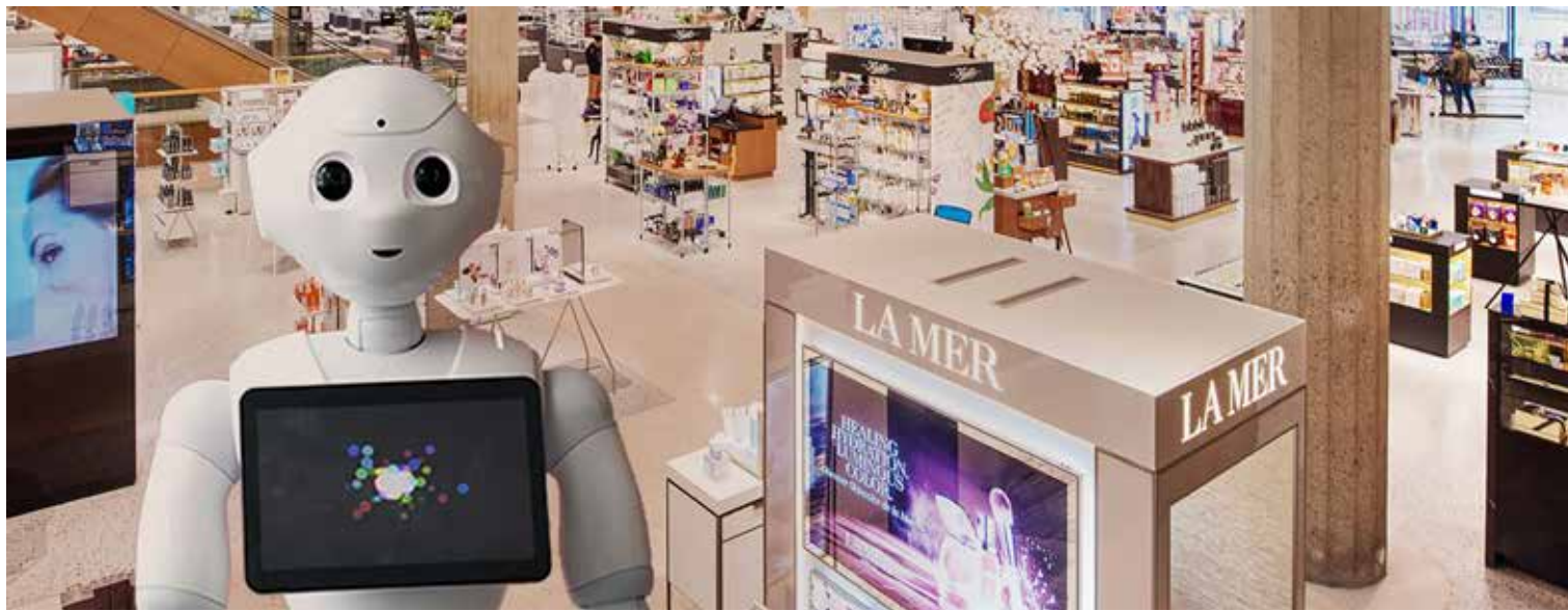
Tijdens de RoboJam werden klanten van De Bijenkorf als een ware VIP verwelkomd door een robot