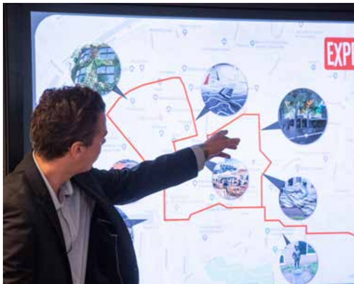
Studenten presenteren hun plannen voor een levendige binnenstad