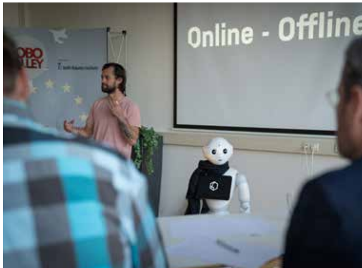
Deelnemers leren hoe een robot de verbindende schakel kan zijn tussen online en offline