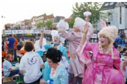
De jaarlijkse Peurbak- kentuocht is onderdeel van de Lakenfeesten, die in juni traditioneel de start zijn van het evenementenseizoen in Leiden. Ook hier komen tienduizenden bezoekers van buiten Leiden op af om de sfeer op te snuiven.